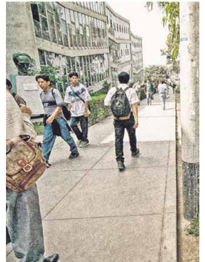
☺ La Católica y la San Marcos son las únicas casas de estudios superiores peruanas que figuran en el ránking de las mejores universidades de América Latina.

Los elementos medulares de una agenda política alterna en nuestro país son: 1) la reorientación del aparato